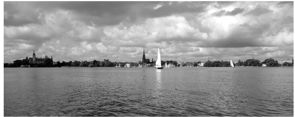
Schwerin 2018 / W. Lippert