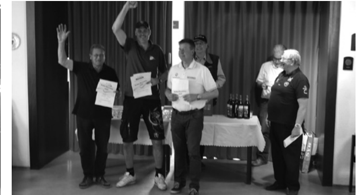
Der glückliche Gewinner seiner ersten Ranglistenregatta