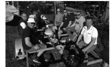
Leckeres Gala-Dinner bei Kaiserwetter